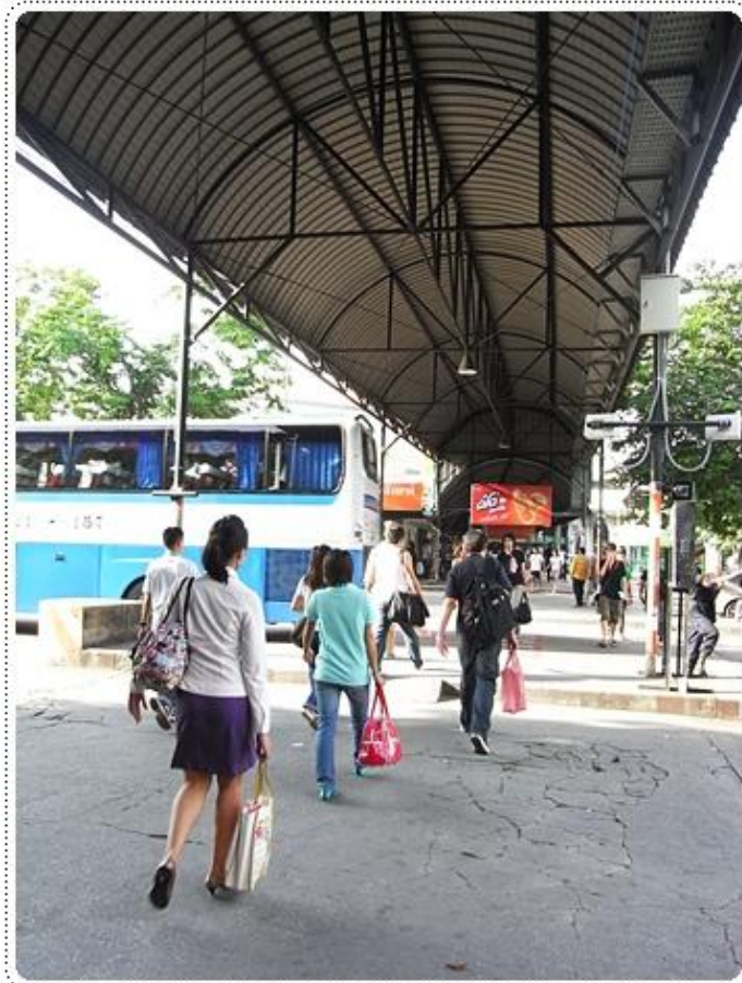
ทางเดินจะมีหลังคาคลุมไปตลอดทางจนถึงตัวอาคารสถานี