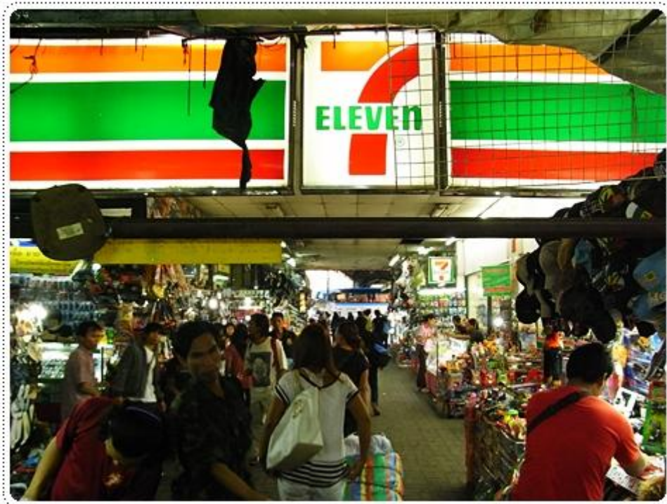
แล้วจะเจอร้านเซเว่น ตรงนี้ก็เดินตรงตามทางไปอย่างเดียวเลย